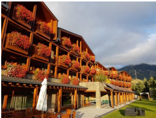
4-Sterne Hotel Nordic in El Tarter